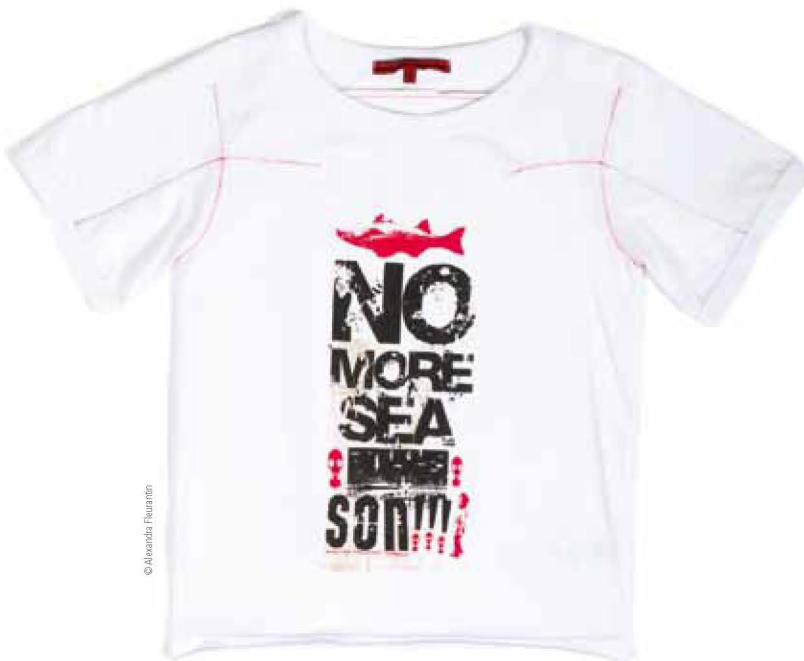
Na-shirt, motif No more sea son, été 2010