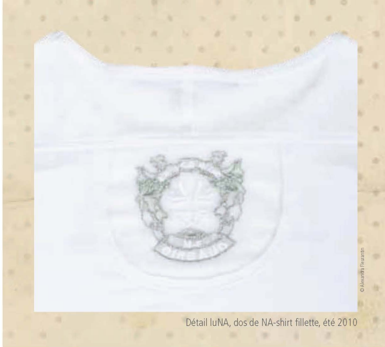
Détail luNA, dos de NA-shirt fillette, été 2010