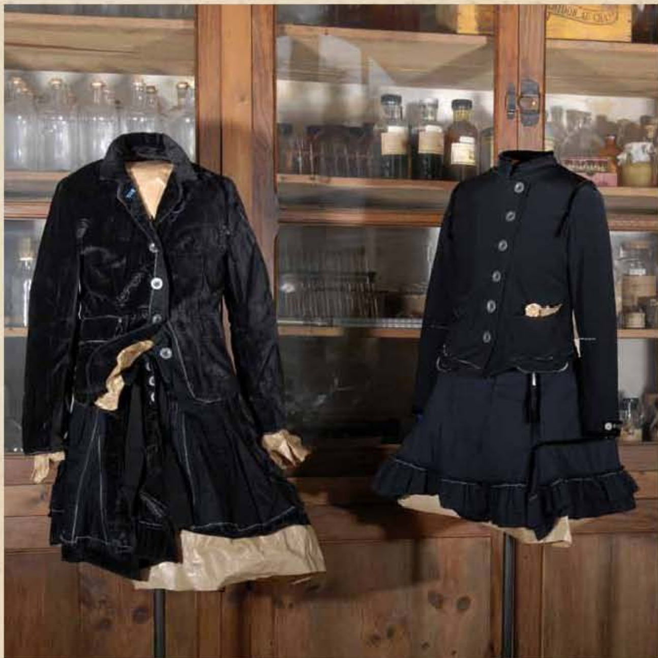
Ensemble en Stretch express, hiver 2007/08

Le second développé pour le maillot de bain intègre l'habillé Girbaud depuis quinze ans. Composé à 72% de microfibre Meryl® (polyamide) et à 28% de Lycra®, il est doux et ultra léger, a une grande capacité d'absorption de l'humidité corporelle, ne se déforme pas, ne nécessite aucun repassage et ne peluche pas, lavable en machine, sèche rapidement. Ce dernier permet des bords francs, des montages coupés-cousus au bénéfice de robes légères, de jupes volantées, de plis élégamment placés.