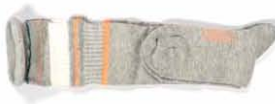
Robe et paire de chaussettes, thème soft and shiny, été 2009

Le sans couture permet aussi une autre aisance. Ainsi, la robe tubulaire s'enfile comme une chaussette. Avec ou sans fibre élastique, elle colle plus ou moins à la peau et adhère plus ou moins au mouvement.